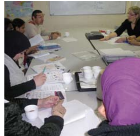
Atelier Socio linguistique Parents d'élèves à la MJC-CS Aimé Césaire (Mermoz) - Viry-Chatillon 2012