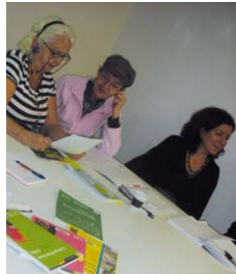
Échange de pratiques des formateurs à la Médiathèque Victor Hugo, lors de la Semaine Santé Bien-Être - Grigny 2011