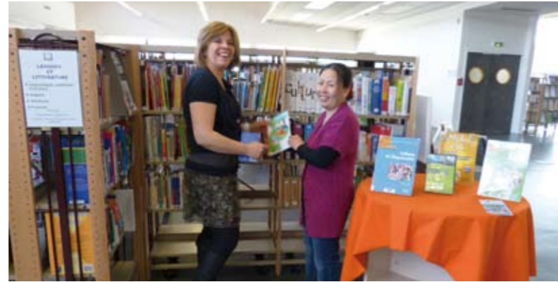
Fonds spécifique pour l'apprentissage du français - Médiathèque Victor Hugo Grigny avril 2012