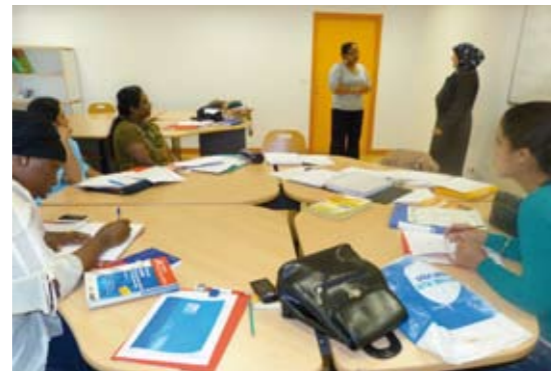
Ateliers de Recherche d'Emploi et d'Apprentissage Linguistique (AREL) - Centre de Formation et de Professionnalisation (CFP) Grigny mai 2012